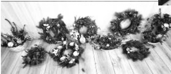
Kerstkransen en bloemstukjes zijn klaar!